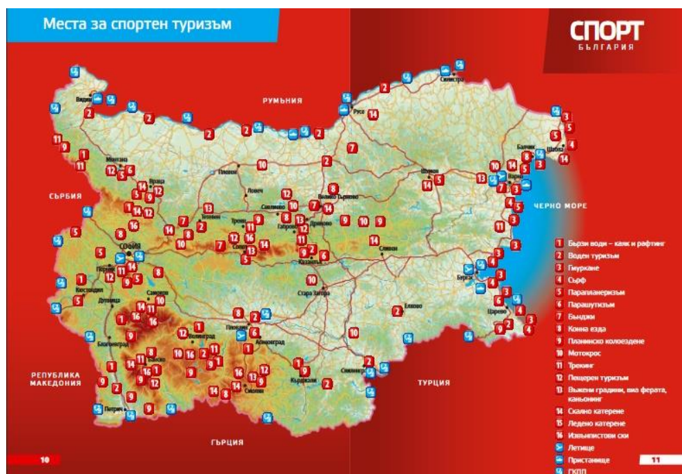
Фиг. 2. Места за спортно-развлекателен туризъм в България

Друго значение за развитието на спортно-развлекателния туризъм е рекламирането на дадена дестинация за такъв вид туризъм и привличането на повече туристи.