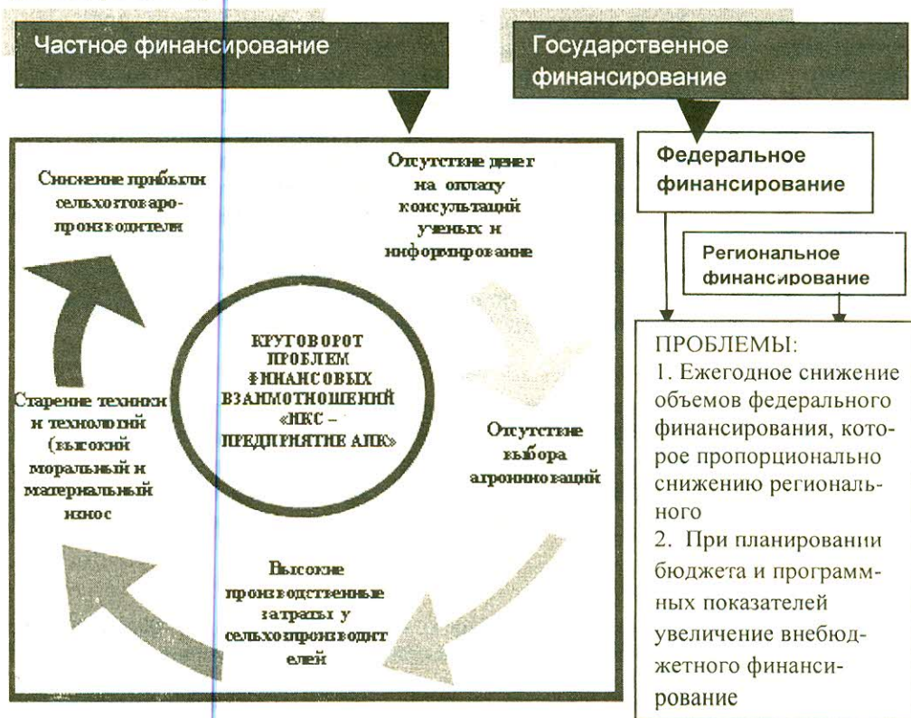
Рис.2 Проблемы финансирования информационно-консультационной деятельности

В результате консультирования как сельхозтоваропроизводители, так и предприятия переработки наблюдается увеличение и экономической эффективности. Так, в сельхозпредприятиях области прибыль от применения рекомендаций ученых-аграриев СГАУ после консультирования увеличивается при правильном соблюдении технологий в растениеводстве на 15 %, в животноводстве на 24 %, совершенствование организационных мероприятий на 8 %. При внедрении агроинноваций в среднем на 26 % (по сравнению с предприятиями не участвующими в консультировании при равных условиях).