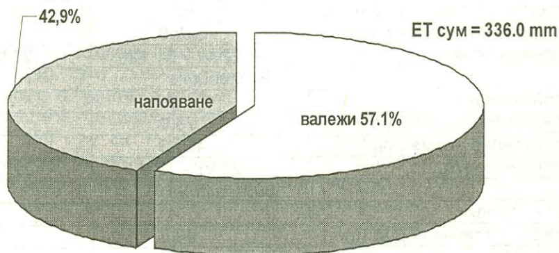
фиг. 1 Формиране на ЕТ на захарното цвекло сорт "Раднево" при неполивни условия - средно за трите опитни години

При неполивни условия ЕТ на захарното цвекло се формира от натрупаните през есенно-зимния период водни запаси в почвата, както и от използваемата част на валежите, паднали през вегетационния период.