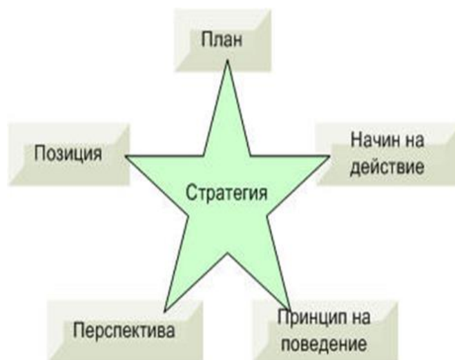
Фиг.1. Стратегии за икономическо развитие

“Устойчиво развитие” е тенденция, която в световен мащаб набира все по-голяма популярност и все повече привърженици. Всяка една компания, която не предприеме устойчиви промени в своето представяне в скоро време ще загуби конкурентни предимства. Концепцията за устойчиво развитие предвижда икономически растеж, който е в състояние да задоволи нуждите на съвременното общество от благосъстояние (с всичките му социално-демографски и здравни особености) в дългосрочен план, без да лишава бъдещите поколения от възможността да задоволят своите нужди (IISD,1992). По-конкретно, устойчивото развитие предполага да се избират и насърчават стратегии за икономическо развитие, съобразени с опазването и подобряването на околната среда и биологичното равновесие на Земята (фиг.1).