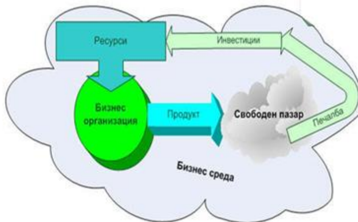
Фиг. 3. Функционален подход в управлението Fig. 3. Functional approach in management