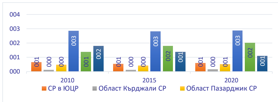
Фигура 1. Заети лица в подсектор Хотелиерство в СР на ЮЦР Figure 1. Employed persons in the Hospitality sub-sector in the RA of the SCR

На фигури 1 и 2 анализираме заетите лица в Хотелиерство и Ресторантьорство в СР на ЮЦР в рамките на десет години. Заетостта е социален елемент, оказващ пряко влияние върху БДС на района, броят и възрастовата структура на населението. Развитието на Туризма и в частност двата подсектора който се представят, са пряко свързани с миграционните процеси, гъстотата на населението и обезлюдяване на района.