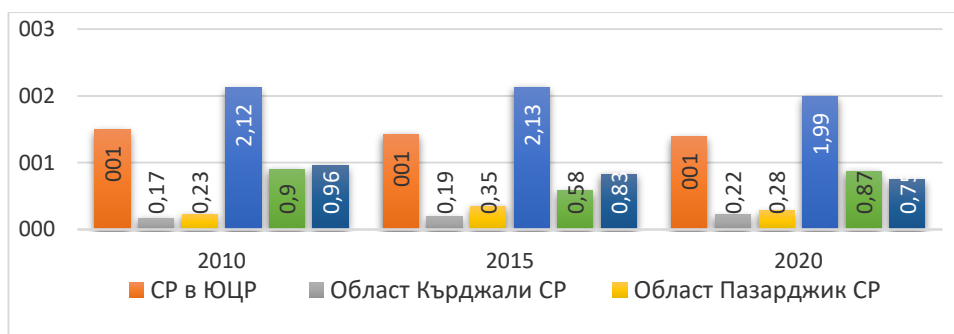
Фигура 4. Предприятия в подсектор Ресторантьорство в СР на ЮЦР Figure 4. Enterprises in the restaurant sub-sector in the RA of the SCR

Индексът на локализация за предприятия в подсектор - Хотелиерство в СР на ЮЦР отчита възходящ тренд през периода на изследване. Базата за развитие на тази услуга е природно климатичната даденост на района и традицията за формиране и развитие на този бизнес. С най-висок коефициент са СР на област Смолян, през целия период на изследване, отново на база природна даденост и традиция в подсектора. Коефициентите за СР на област Пловдив за десетте години отчитат локализация. Развитието на общините е свързано с природните дадености, близостта до голям център, археология, традиция и не на последно място етно-културни ценности. Селските райони на област Хасково, отчитат коефициенти над единица за целия период, на база фактори идентични с тези от предходната област. С най-ниски стойности са СР на областите Пазарджик и Кърджали, под единица с минимална локализация на този подсектор (Nikolov end ets., 2014).