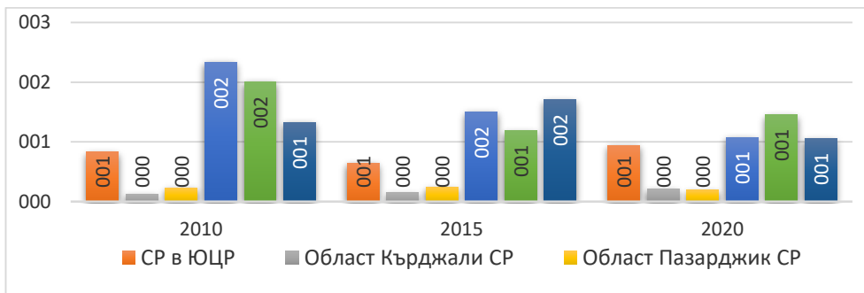
Фигура 2. Заети лица в подсектор Ресторантьорство в СР на ЮЦР Figure 2. Employed persons in the Restaurant sub-sector in the RA of the SCR